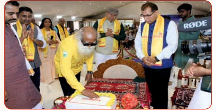
Sadhguru Jaggi Vasudev visited Vishv Umiyadham Ahmedabad and performed Shila Poojan