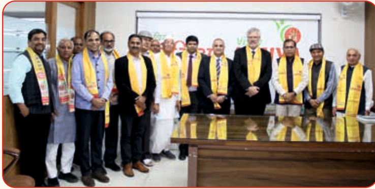
Ambassador of the Government of Israel Shri Naor Gilon and the Consul General of Israel Mr. Kobbi visited Vishv Umiyadham - Ahmedabad