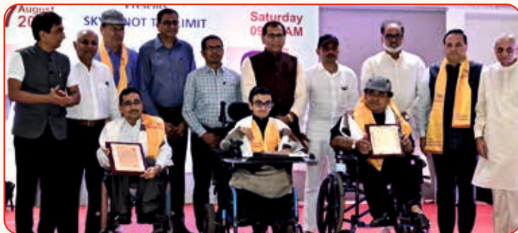
Shri Sparsh Shah Motivational Speaker, Rapper, Singer, Song Writer