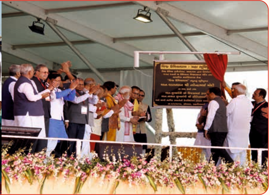
Maha Bhoomi Poojan of Vishv Umiyadham Ahmedabad by Hon'ble Prime Minister Shri Narendrabhai Modi