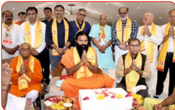
Vishv Yog Guru Shri Swami Ramdevji visited Vishv Umiyadham Ahmedabad